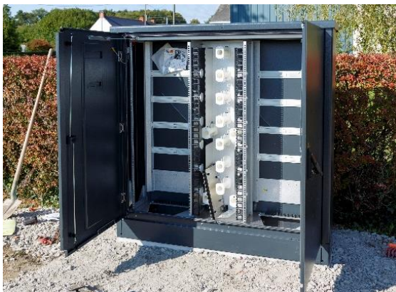
Armoire venant d'être installée